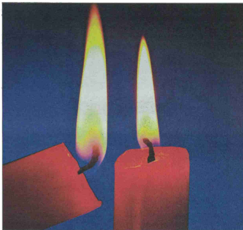
Zwei Jahre swisscleantech, in denen einiges bewegt wurde.

Der grosse Wirtschaftsdachverband economiesuisse stellte sich hinter den Vorschlag des Bundesrats. Sein kleiner Bruder swisscleantech hatte bereits in der Sommersession 2010 im Nationalrat zu denen gehört, die sich für eine Verringerung im Inland um 20 Prozent eingesetzt hatten. Der Nationalrat stellte sich mit einer wenn auch knappen Mehrheit auf die Seite von swisscleantech. «Dieses Ziel ist wirtschaftlich attraktiv und klimapolitisch korrekt», sagte Nick Beglinger, Präsident von swisscleantech. Vor der Ausmarchung im Ständerat schien es dennoch so, als würde dieser den Entscheid des Nationalrats kippen – obwohl selbst Bertrand Piccard, Präsident des Patronatskomitees von swisscleantech, in der Woche vor der Abstimmung Ständeräte persönlich für eine ehrgeizige Klimapolitik zu gewinnen versuchte. Doch dann entschied sich der Ständerat klar für das 20-Prozent-Ziel.