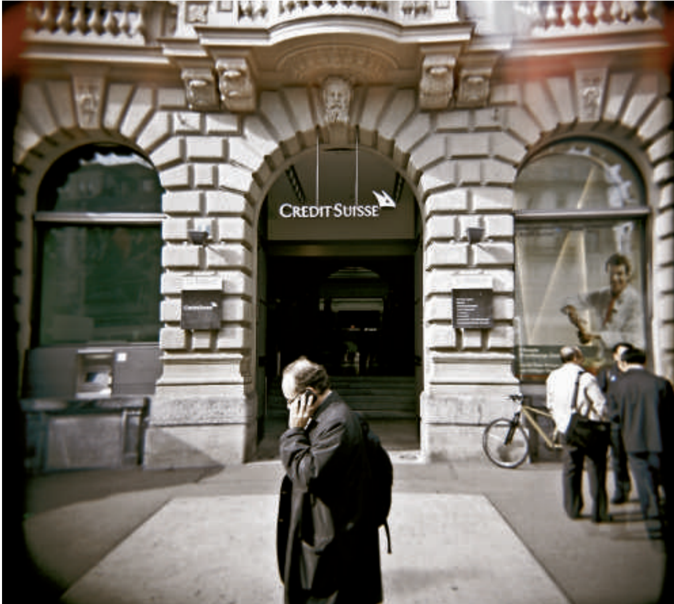
Ohne massive Einschnitte im Investmentbanking müsste die CS bis zu 20 Milliarden Eigenkapital auftreiben.

Das dürfte den arg gebeutelten Aktienkurs weiter stützen.