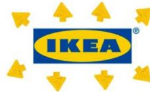
Einfluss von IKEA