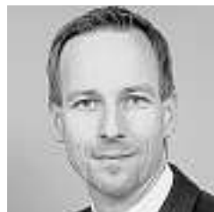
Von Rico Huber*

Der Swiss Market Index (SMI; gegenüber der Vorwoche +1,3 Prozent auf 6443,01 Punkte) ist nach einem ruhigen Handelsverlauf positiv in die Woche gestartet. Es wurden wenig Neuigkeiten von Seiten der Unternehmen bekannt und Publikationen von Konjunkturdaten blieben aus. Die Bankentitel zeigten zur Wochenmitte aufgrund der guten Quartalszahlen der US-Bank JP Morgan stark positive Tendenzen, was den SMI auf 6455 Punkte anhub. Die am Donnerstag publizierten Umsatzzahlen von Schweizer Unternehmen verursachten einen uneinheitlichen Kursverlauf des SMI, der sich gestern fortsetzte. Zu den Gewinnern der Woche gehörten Actelion, Syngenta und Transocean; während Lonza und Swisscom die schlechteste Kursentwicklung im SMI aufwiesen.