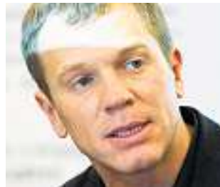
«Swisstech steht dafür, Probleme als Chancen zu sehen»

Aus der Sicht des Verbandes braucht es aber zusätzlich verstärkte – auch staatliche – Anstrengungen zur Förderung von Cleantech. Dazu gehört die Einrichtung einer zentralen Cleantech-Anlaufstelle ebenso wie einen Informationsdienst, der einen Überblick über alle cleantech-relevanten Innovationen in der Schweiz gibt. Darüber hinaus sollten Cleantech-Innovationsparks eingerichtet werden. Ein möglicher Standort: der Militärflugplatz Dübendorf.